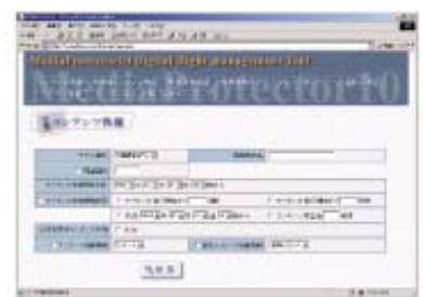
コンテンツの再生回数や有効期限、再配布の可否などがArcMediaProtectorの管理画面で簡単に設定できる

ArcMediaProtectorを導入して2007年1月からe-ラーニング用教材の著作権保護を図っているのが、コンフォートホテル、クオリティホテルの2ブランドで全国にホテルを展開するチョイスホテルズジャパンだ。同社では客室の清掃や緊急時の対応など、接客全般について動画で従業員を教育している。CD-Rに収録された教材を再生する際はユーザーIDとパスワードの入力が必要で、認証されないと受講することができ